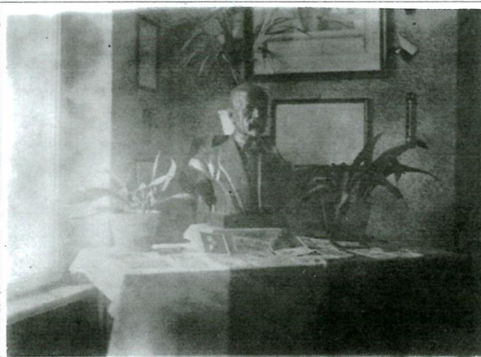
Benesův koutek. 28. 11. 1936.