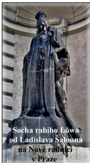
Socha rabiho Löwa od Ladislava Šalouna na Nové radnici v Praze

Nejdříve jsme si prohlédli Maiselovu synagogu, kde byly k vidění koruny na Tóru a model ghetta, a poté navštívili synagogu Pinkasovu, na jejíchž stěnách bývala napsána jména českých a moravských Židů, zavražděných v koncentračních táborech. Oběti holocaustu připomíná rovněž stálá expozice dětských kreseb z koncentračního tábora Terezín. Nedaleko