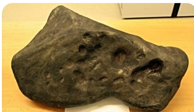
Model původního železného meteoritu Loket

Jednou k purkrabímu přišla stará, chudá vdova. Měla plno dětí, a když se její muž rozstal a zemřel, nebyl v rodině nikdo, kdo by mohl chodit na robotu a vydělávat na daně. Vdova doufala, že oblomí ledové srdce purkrabího. Narazila však na nezáměr a pohrdání. Nakonec ho v zoufalství proklela: „ Za to, že máš srdce z kamene, tak se proměň v kámen! “ Jen to dořekla, nad hradem se náhle setmělo. Z temného mraku sjel blesk, který udeřil do arkýře, kde stál purkrabí. Když se dým rozplynul, ležel na místě markraběte velký žhavý kámen. Byl tak těžký, že ho po vychladnutí nedokázal nikdo uzvednout. A když do něj silně udeřili, zvonil jako zvon. Kámen studovali tehdejší alchymisté a mudrcové, ale na nic nepřišli. Nakonec ho pojmenovali "Zakletý purkrabí".