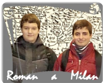
Roman a Milan

Protože vím, že by se rádi stali učiteli dějepisu, zrodil se nápad - na jednu hodinu by se chlapci stali učiteli dějepisu v 6. třídě.