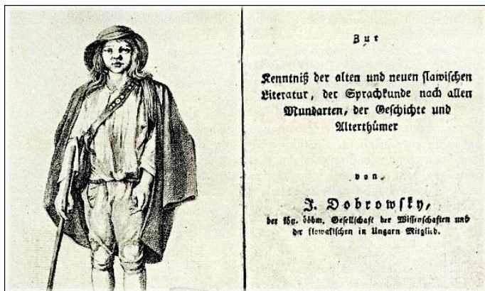
Novodobé dějiny snah o uzákonění češtiny jako národního jazyka začínají u Josefa Dobrovského.

3. února 2021 uplynulo 95 let od chvíle, kdy u nás vešel do praxe „ústavní zákon jazykový“. Počínaje třetím únorem 1926 se čeština v mladé Československé republice konečně stala úřední řečí.