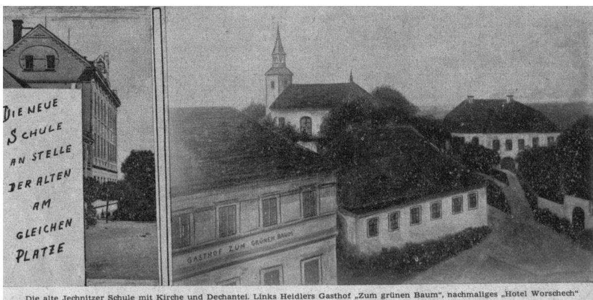
Die alte Jechtnitzer Schule mit Kirche und Dechantel. Links Heiders Gasthof „Zum grünen Baum“, nachmaliges „Hotel Worschek“

Ta byla jako nevyhovující, o stavbě nové obecné a měšťanské školy jednala školní rada od roku 1894, nejdříve se snaží koupit různé měšťanské domy, až nakonec starou budovu strhnou a na jejím místě postaví školu novou o 8 třídách. Stavba probíhá od 16. 9. 1903 do 16. 10. 1904, stojí 100 000 korun předválečných rakouských.