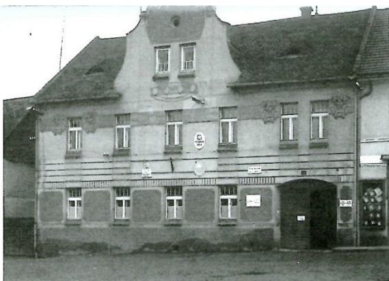
Čkresní dům č. 98 v Jesenici v 1. poschodí čis. školy.