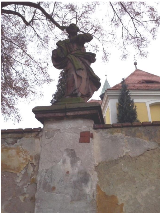
Svatý Jan Křtitel

Na ohradní zdi před kostelem vidíme sochy světců - zleva jsou to: