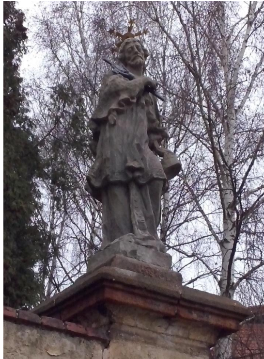
Svatý Jan Nepomucký.

V roce 2014 byl před kostelem nainstalován informační panel, kde se dozvíte o kostelu mnohem více.