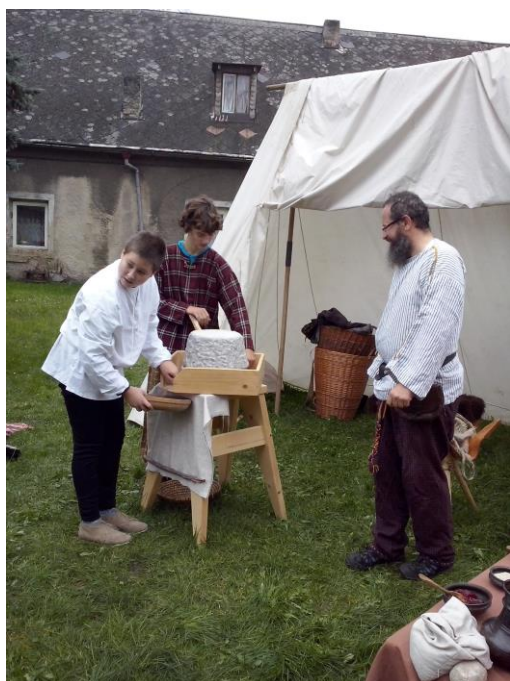
Pak umeleme na keltském rotačním mlýnku.