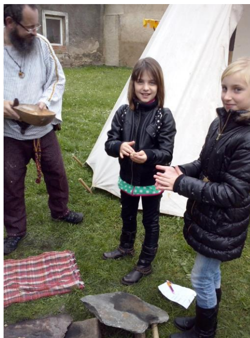
A utvoříme placičky.