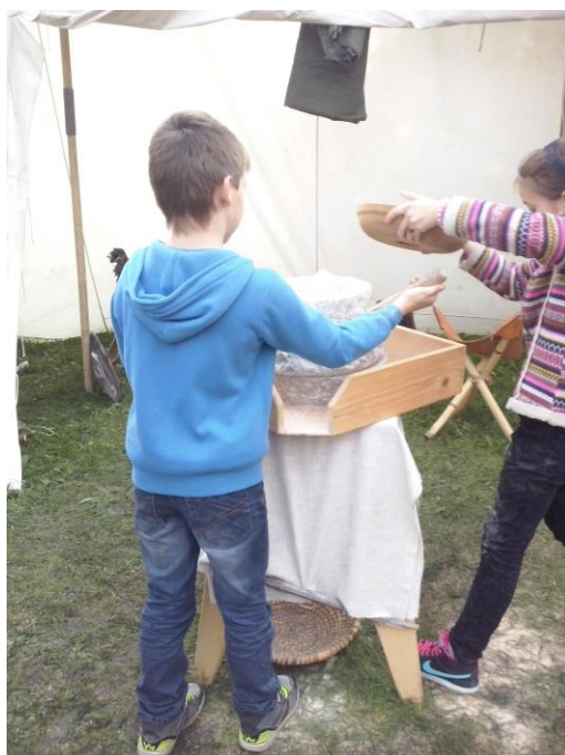
Ještě přidáme, ať je dost placiček.