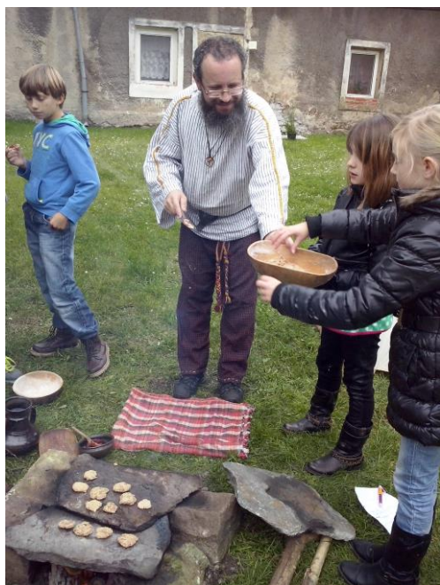
Těsto rozmícháme s vodou.