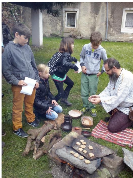
A šup s nimi na ohýnek.