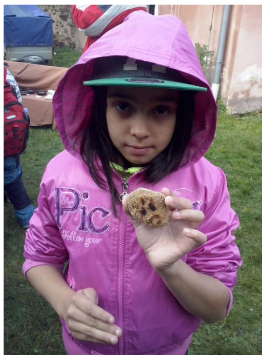
Hotovo. Je libo s medem nebo jamem?